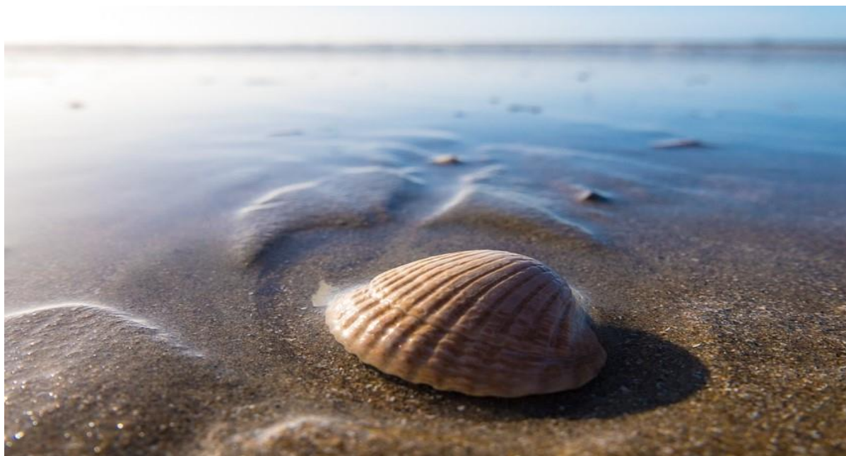
Fot. 2.