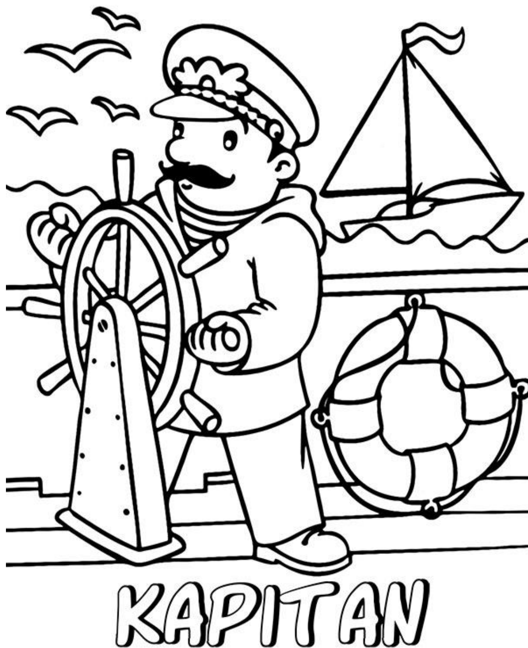
Rys. 1. https://www.e-kolorowanki.eu