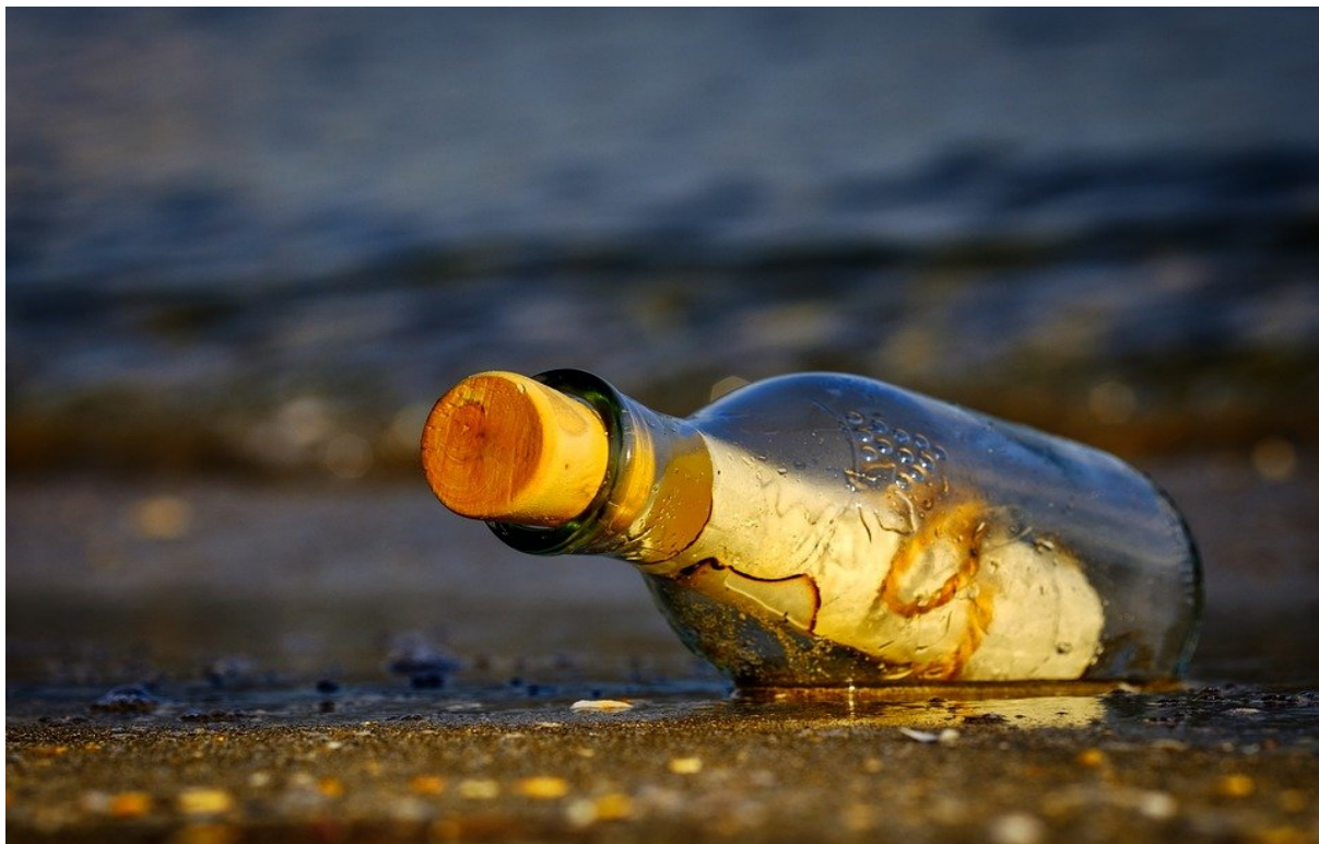
Fot. 3.

Takie oto dziedzictwo 8 przeszło na kapitana Wawrzyńca, który za punkt honoru przyjął sobie wypełnienie tej spuścizny 9 , spełnienie marzeń pradziada.