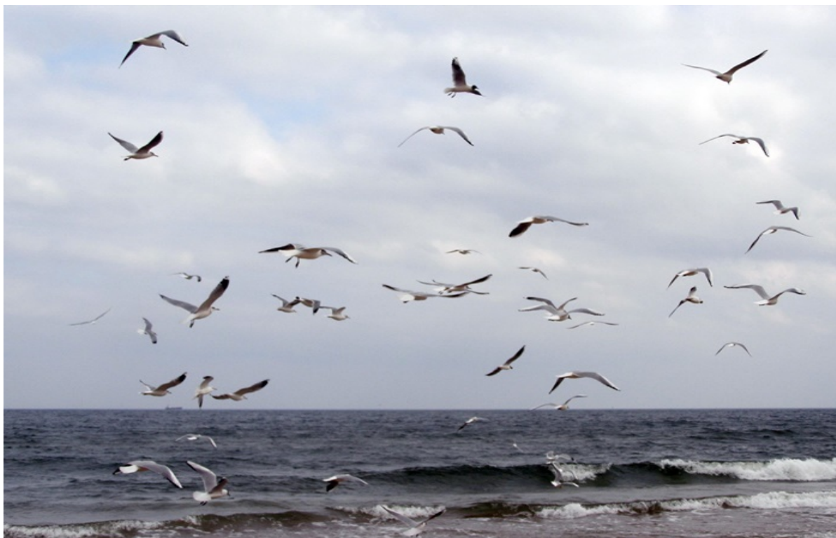
Fot. 4. Maria Pijas

2. Przeczytaj uważnie poniższe pytania. Podkreśl w przeczytanym tekście właściwe fragmenty, a następnie udziel pisemnej odpowiedzi na postawione pytania. Możesz przytoczyć odpowiednie cytaty z tekstu.