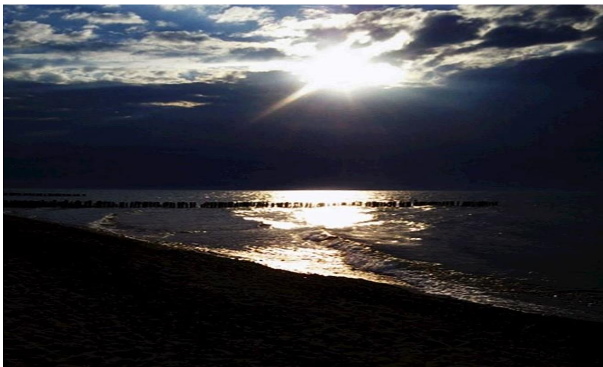
Fot. 2. Maria Pijas

2. Na podstawie tekstu udziel pisemnych odpowiedzi na pytania.