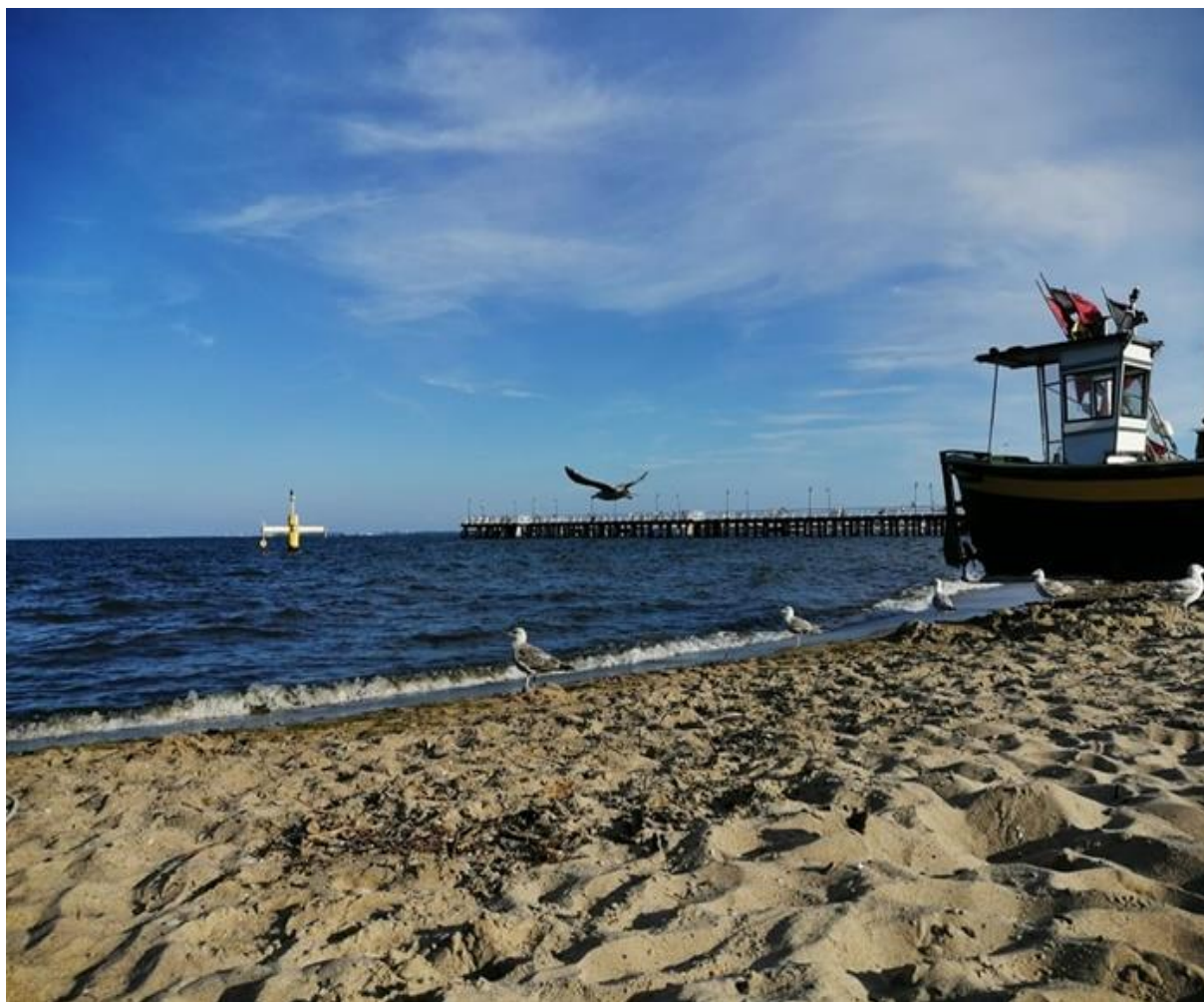
Fot. 2. Marta Pijas

Śpiewające Brzdące – Ocean nam niestraszny – Piosenki dla dzieci