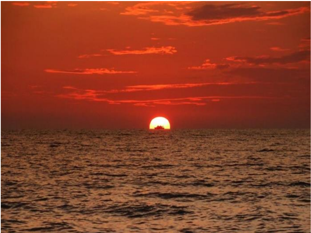
Fot. 1. Maria Pijas

Kapitanowi Wawrzyńcowi i jego załodze będziemy towarzyszyć w kolejnych etapach wyprawy po ukryty skarb. Zapraszam!