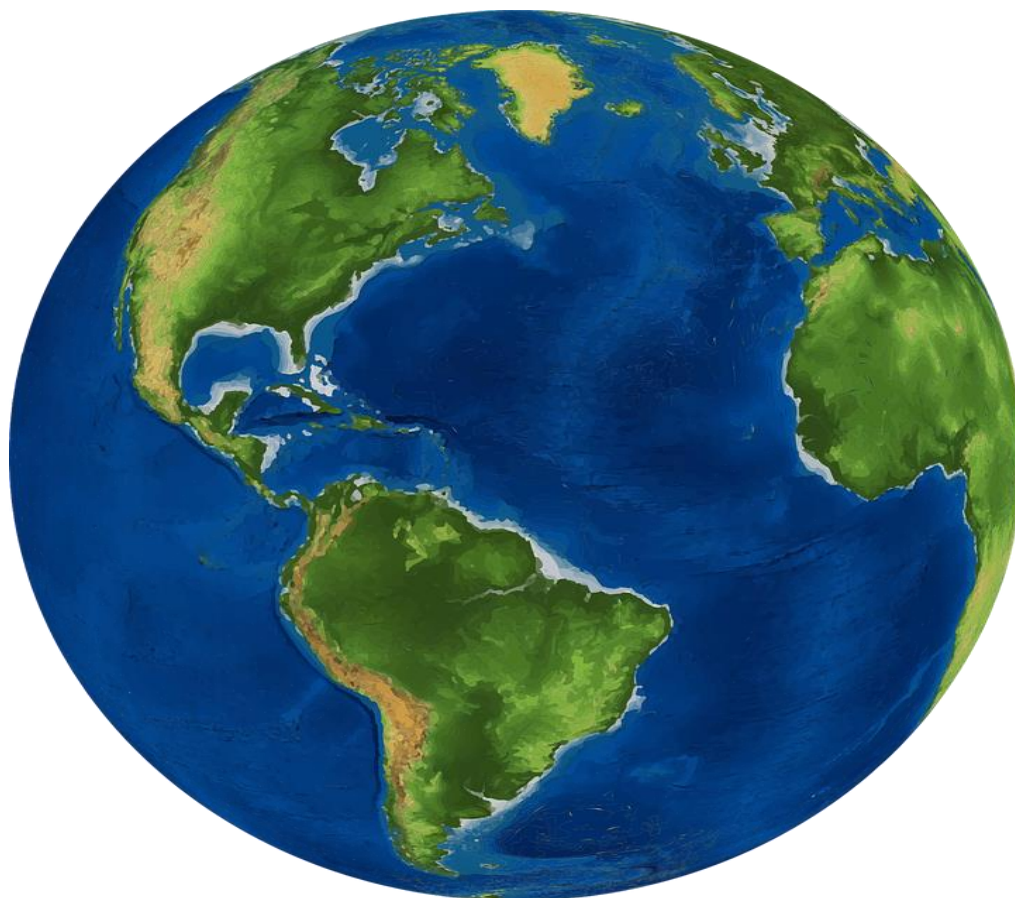
Rys. 1.

4. Pokoloruj zgodnie z legendą kontynenty na załączonej na następnej stronie mapie świata: